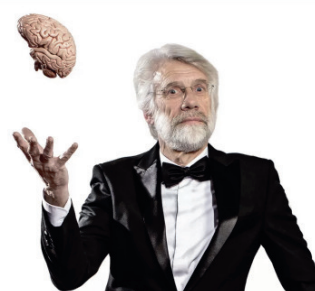
Neuropsycholoog Erik Scherder: Puzzelen zorgt voor een fitter brein, juist nu belangrijk